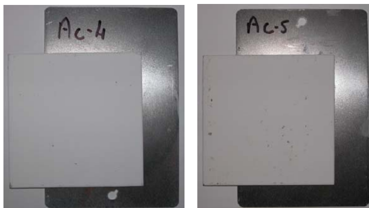
Figura 1. Campioni in laterizio pervenuti al laboratorio

La sperimentazione è stata realizzata preliminarmente sui campioni evidenziati in Tabella 1, rispettivamente AC-1, AC-4, AC-5 e RM-3. In Figura1 sono riportate la fotografie di due dei quattro campioni testati. La morfologia dei campioni è tale da consentire la realizzazione di un provino solido contenente la vernice termica da caratterizzare grazie alla struttura "portante" costituita dalla lamina metallica che, al contempo, costituisce un elemento a conducibilità termica idealmente infinita se paragonato con l'elemento vernice termica in modo da fornire un contributo piuttosto limitato in termini di resistenza termica. In tal modo è più semplice discriminare la conducibilità del solo strato di vernice data la grande disparità, da un punto di vista termico, dei materiali a contatto.